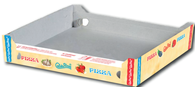
IMMAGINE E DISEGNO TECNICO