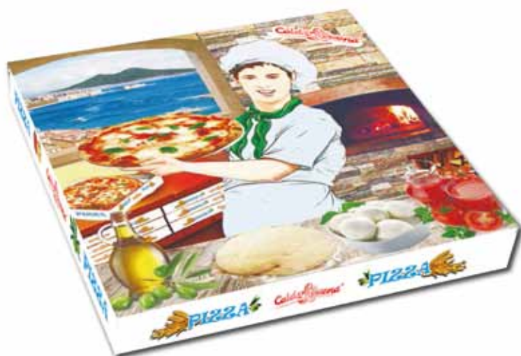
IMMAGINE E DISEGNO TECNICO