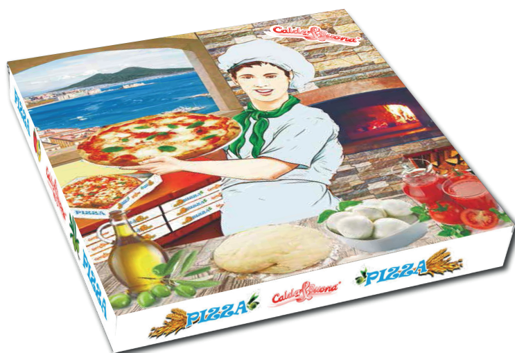
IMMAGINE E DISEGNO TECNICO