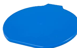
Optional : Coperchio 80111