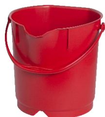
Secchio 9 L – 80102