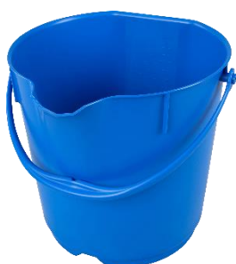
Secchio 15 L - 80101