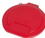
Optional : Coperchio 80112